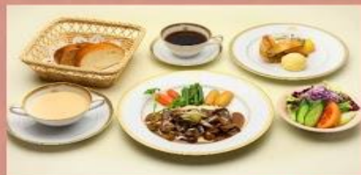
日光金谷酒店午餐