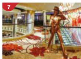
尊邸™ 沉醉在尊尼獲加頂級威士忌的醇香中