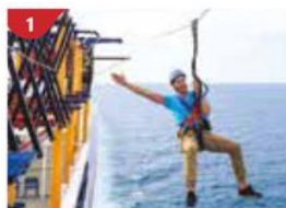
繩索場 挑戰長達35米的海上滑索，體驗「空中飛人」的新奇刺激

所有16歲或以上旅客必須於出發前最少14日完成2019冠狀病毒疫苗接種。而所有旅客亦須於登船前48小時內收到COVID-19核酸檢驗陰性報告，並於碼頭使用安心出行應用程式。