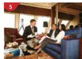
皇宮 尊享歐式私人管家服務及專屬設施