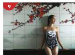
水晶生活™ 全方位中西式水療體驗，配備健身中心及健康餐吧