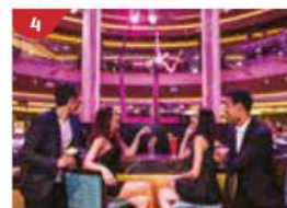
360吧 淺酌一杯香檳，欣賞充滿律動的現場音樂和精彩的雜技表演