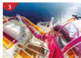
水上滑梯樂園 多達6條各具特色的水滑梯，感受水花四濺的心跳瞬間