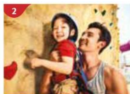
攀岩牆 約上三五好友，在海上攀岩牆來一場體力與耐力的較量