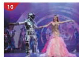
星座劇院 欣賞由蜚聲國際的娛樂團隊精心打造的大型表演