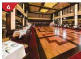
星夢餐廳 在裝潢優雅的雙層餐廳中盡情品嚐地道亞洲及國際美食