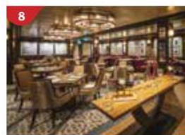
海珍舫及1號扒房 (由名廚馬克·貝斯特主理) 享譽全球的澳大利亞名廚馬克·貝斯特打造海上饕餮餐宴