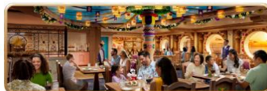
Enchanted Summer Restaurant