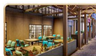
Mike & Sulley's