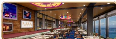
Pixar Market Restaurant