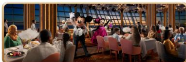
Hollywood Spotlight Club