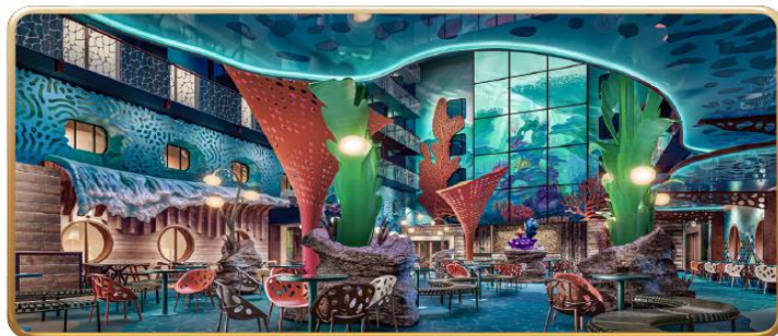
Disney Discovery Reef