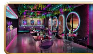
Bewitching Boba & Brews