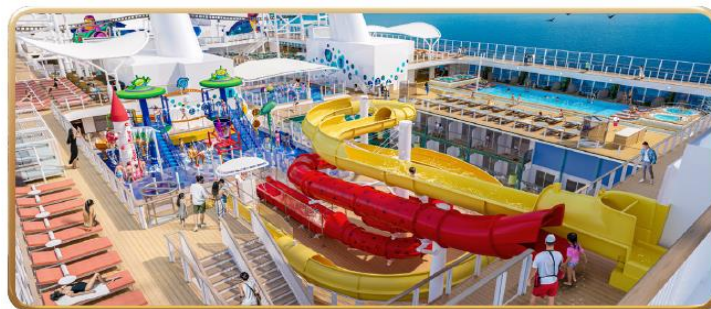
Toy Story Place