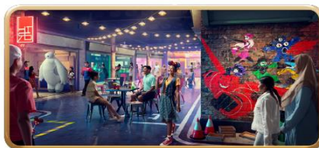
San Fransokyo Street