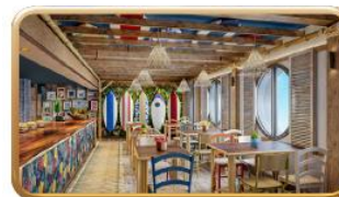
Stitch's 'Ohana Grill