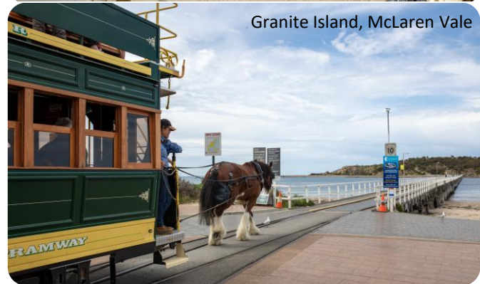
Granite Island, McLaren Vale