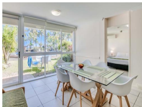
One-bedroom Family Suite