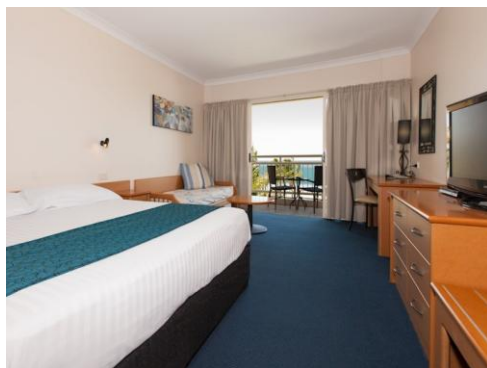
Hotel Deluxe Room (Twin / King)