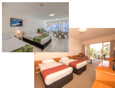
Hotel Standard Room/Resort Unit

入住3晚 Tangalooma Island Resort, Moreton Island 摩頓島天閣露瑪度假村