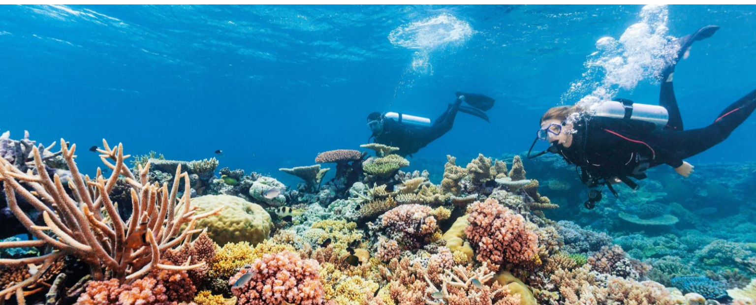
Quicksilver Reef Cruises – Agincourt Reef

4夜 [出發日期：至2026年2月28日] | 4 Nights [Travel Period：Till 28Feb26]