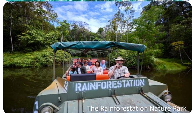
The Rainforestation Nature Park