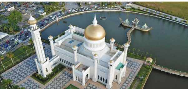
奧瑪阿里賽義夫汀清真寺 Omar Ali Saifuddien Mosque