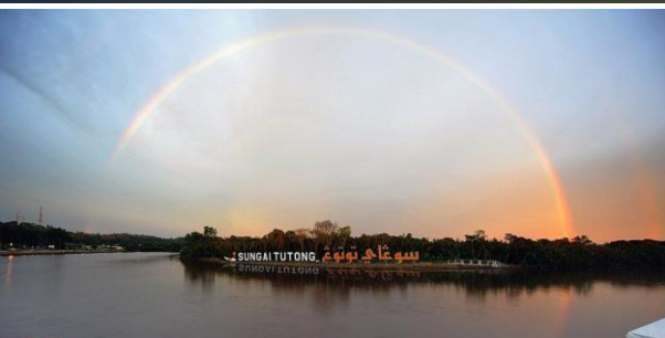
都東河 Sungai Tutong