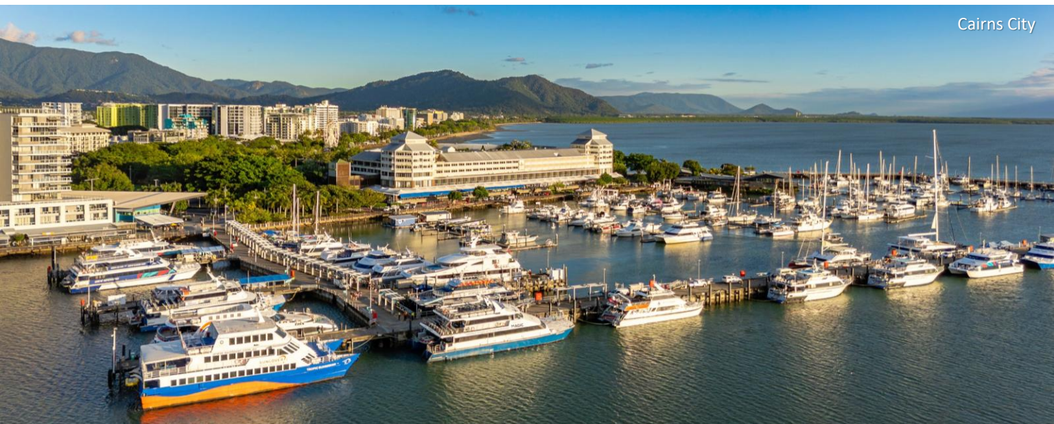
Sunlover Reef Cruises