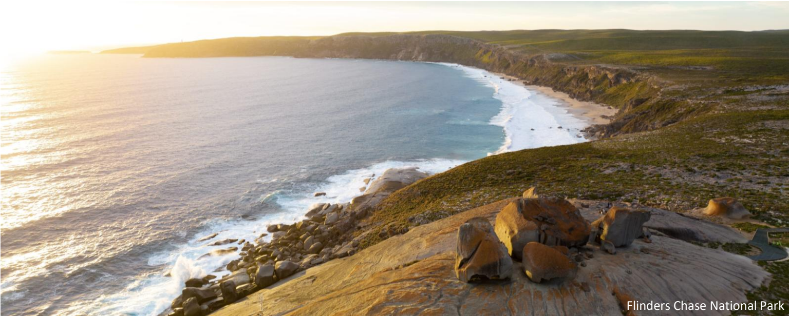
Flinders Chase National Park