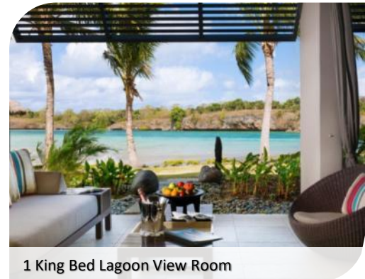
1 King Bed Lagoon View Room