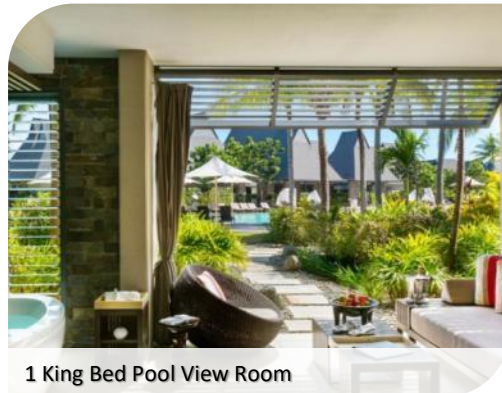
1 King Bed Pool View Room