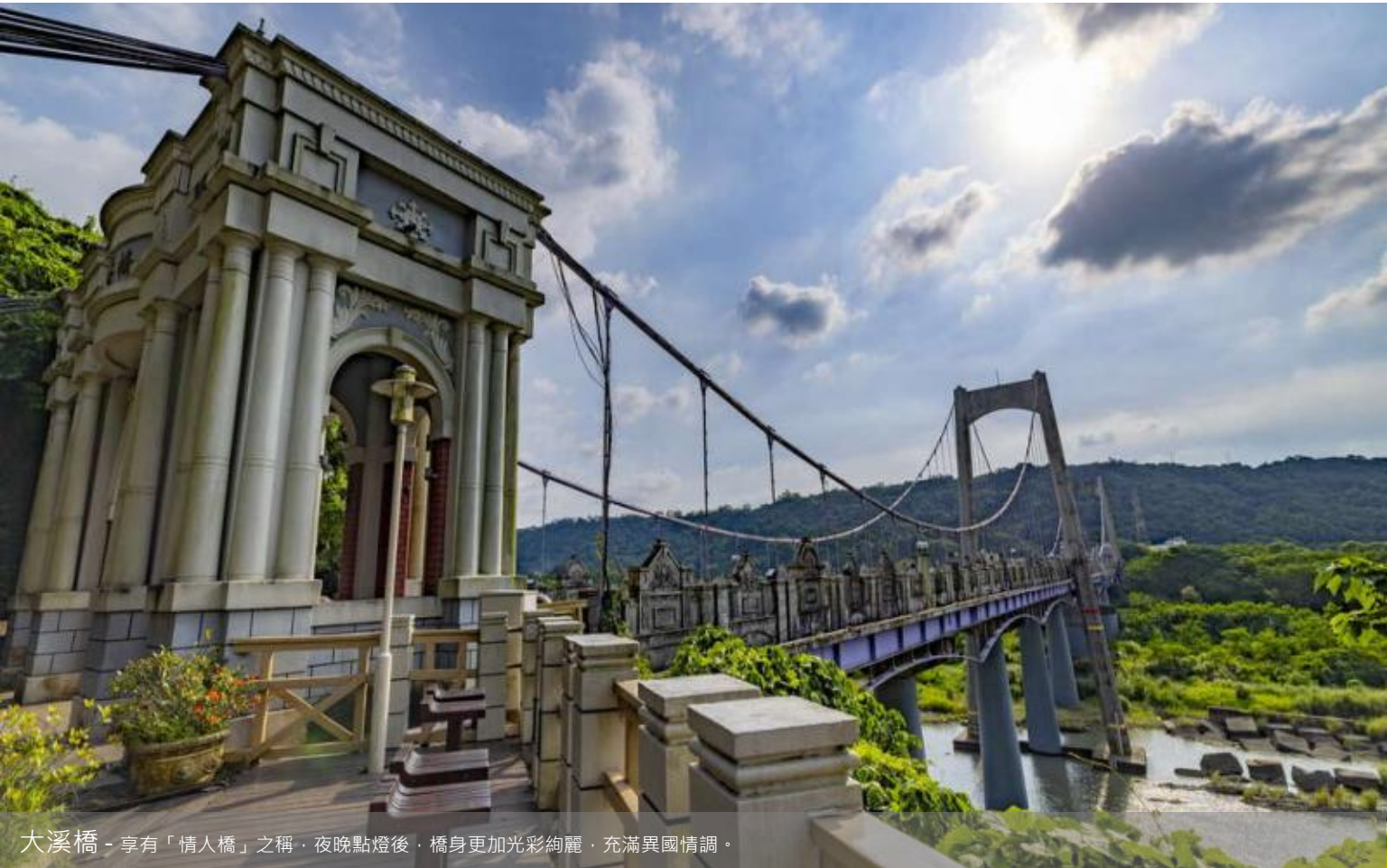
大溪橋 - 享有「情人橋」之稱，夜晚點燈後，橋身更加光彩絢麗，充滿異國情調。

4日3夜套票 4Days 3Nights | 出發日期：即日起至2025年12月31日 Travel Period : Till to 31Dec2025