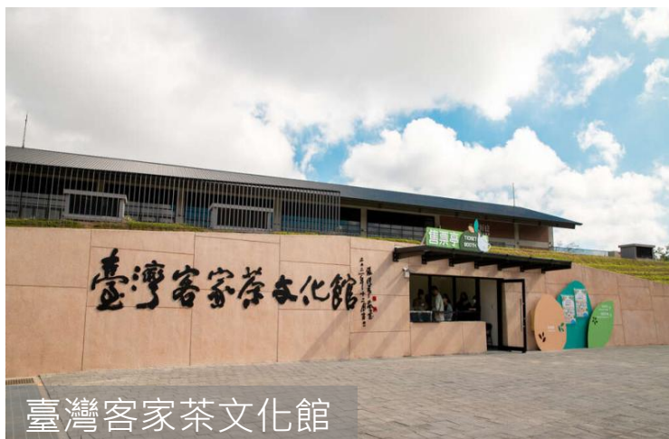
臺灣客家茶文化館

「小烏來瀑布風景區」小烏來風景特定區位於桃園市復興區，是結合壯麗瀑布、森林步道與原住民文化的自然系景點。小烏來瀑布是三層式瀑布，以中段最為壯觀，屬於斷層懸谷型瀑布，水流自約50公尺高處直瀉而下，形成壯麗的景觀。天空步道懸空於瀑布上方，遊客可以走上玻璃棧道俯瞰瀑布。夏季時，宇內溪戲水區開放，有更衣室可以方便玩水後更換衣服，是親子戲水的好去處。