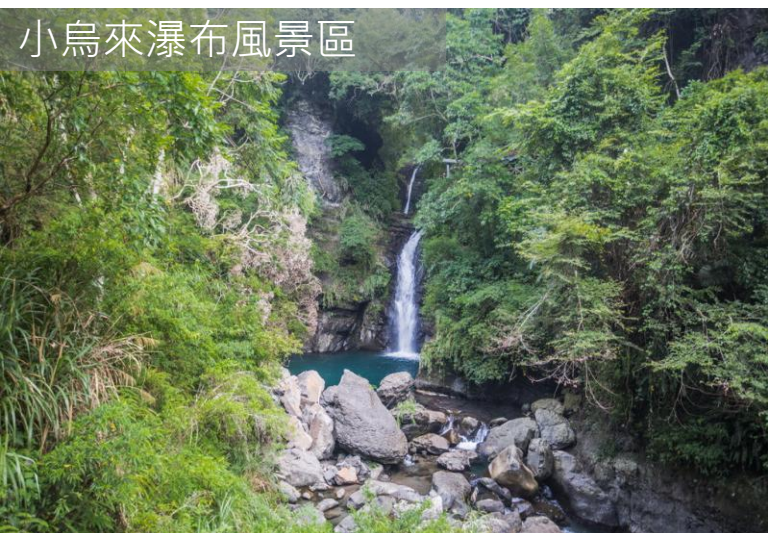
小烏來瀑布風景區

「小烏來瀑布風景區」小烏來風景特定區位於桃園市復興區，是結合壯麗瀑布、森林步道與原住民文化的自然系景點。小烏來瀑布是三層式瀑布，以中段最為壯觀，屬於斷層懸谷型瀑布，水流自約50公尺高處直瀉而下，形成壯麗的景觀。天空步道懸空於瀑布上方，遊客可以走上玻璃棧道俯瞰瀑布。夏季時，宇內溪戲水區開放，有更衣室可以方便玩水後更換衣服，是親子戲水的好去處。