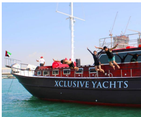
杜拜碼頭帆船之旅