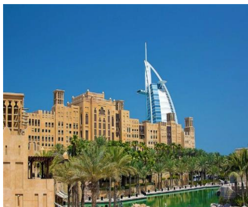
杜拜老城區半日遊 + 哈利法塔