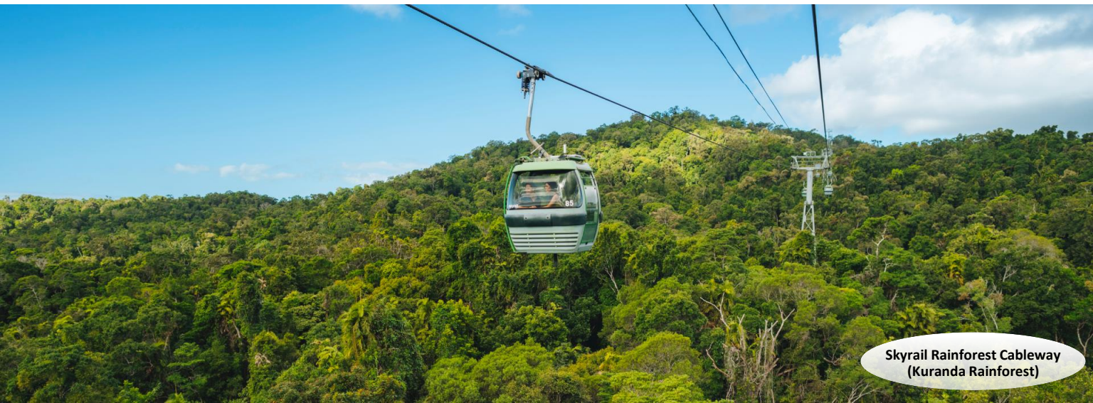
Skyrail Rainforest Cableway (Kuranda Rainforest)

5日4夜 [出發日期: 至2025年3月29日] | 5 Days 4 Nights [Travel Period: Till 29Mar2025]