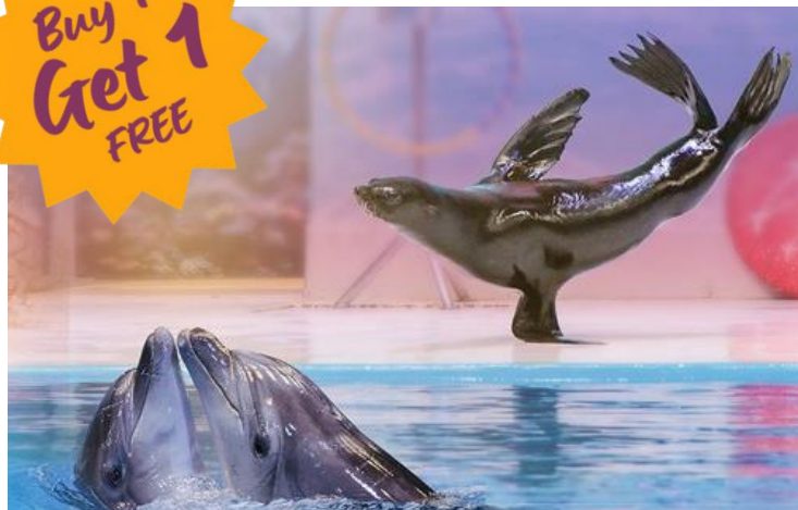
Dubai Dolphinarium – Dolphin & Seal Show Ticket