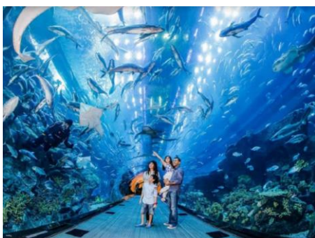
失落的空間水族館