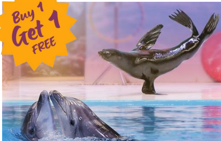
Dubai Dolphinarium – Dolphin & Seal Show Ticket