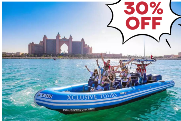
90 Min Guided Sightseeing Tour