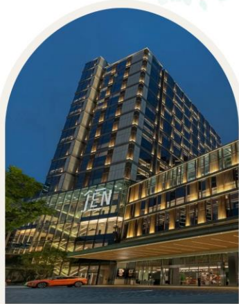
JEN SHENZHEN QIANHAI BY SHANGRI-LA