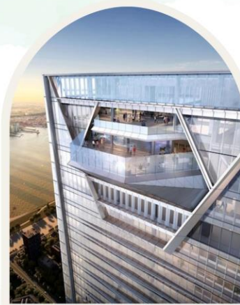
SHANGRI-LA NANSHAN SHENZEHN