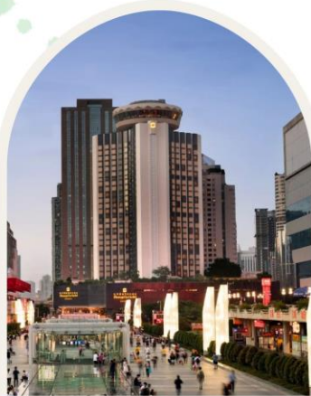
SHANGRI-LA HOTEL SHENZHEN