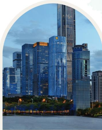
FUTIAN SHANGRI-LA SHENZHEN