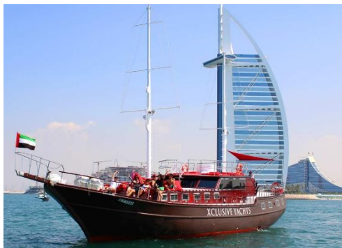
迪拜碼頭帆船之旅